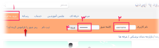
تصویر یک - نحوه ورود به ایردن

یک) ورود به ایردن - برای دسترسی به بخش اطلاعات غرفه، باید ابتدا با وارد کردن "نام کاربری" و "رمز عبور"، به ایردن وارد شد. برای ورود، در قسمت کشویی بالای صفحه، نام کاربری و رمز عبور را نوشته، روی " ورود " کلیک کنید. (تصویر ۱).