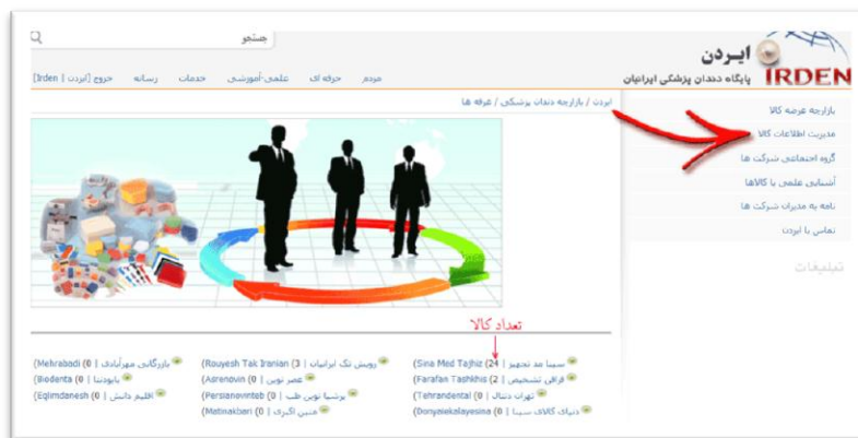
تصویر ۲- لیست غرفه های بازارچه و منوی ورود به بخش ویرایش اطلاعات کالا

(دو) بخش مدیریت اطلاعات کالاها- در قسمت منوی سمت راست بازارچه، لینک به بخش "مدیریت اطلاعات کالا" وجود دارد (تصویر ۲).