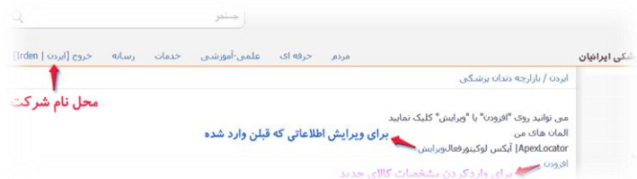
تصویر ۳ و ۴- بالا: وارد کردن یا ویرایش اطلاعات یک کالا | پایین: روش تکمیل فیلدها در پروفایل کالا

(سه) روش ایجاد و ویرایش فایل معرفی کالا- در صفحه جدید می توانید روی "افزودن کالا" و یا "ویرایش کالا" کلیک نموده و جدیدترین اطلاعات کالای شرکت را وارد نمایید (تصویرهای ۳ و ۴).